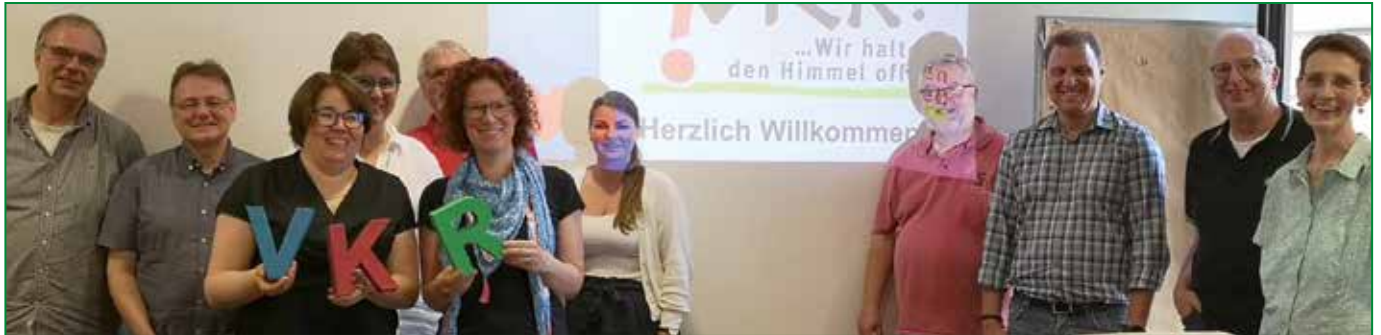
Gute Stimmung bei der Landesdelegiertenversammlung in Essen.