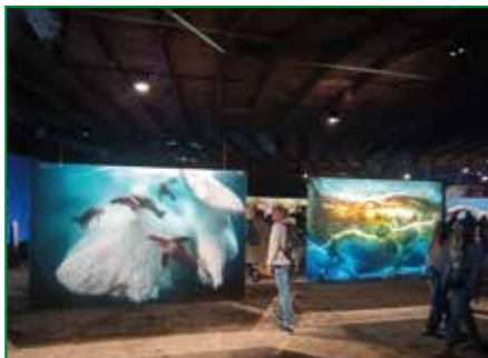
Eintauchen in Unterwasserwelten.

Schüler*innen, die ohne Taucheranzug und Atemmaske ganz entspannt vom Meeresboden aus den Fischen und Quallen zusehen, konnte man unlängst im Gasometer Oberhausen antreffen. Hierzu lud die große immersive Inszenierung „Die Welle“ im Luftraum des Gasometers ein. Die Gesundheitskaufleute des Klaus-Steilmann-Berufskollegs besuchten zum Abschluss der Unterrichtseinheit „Die Schönheit der Schöpfung“ mit ihrem Religionslehrer Christoph Wiechers die Ausstellung „Planet Ozean“.