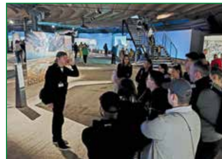
Führung durch die immersive Ausstellung.

Großformatige Fotografien und Filme eröffnen ungewöhnliche Perspektiven auf die Ozeane unseres Planeten. Neben eindrucksvollen Bildern von Meeresbewohnern und der Tiefsee geht es auch um die Folgen der menschlichen Nutzung der Weltmeere als Energielieferant, Transportstrecke oder Nahrungsquelle. Eine einstündige Führung lieferte Informationen zu den oft verheerenden Eingriffen des