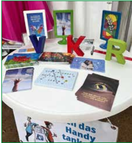
Der VKR lädt ein, miteinander ins Gespräch zu kommen.