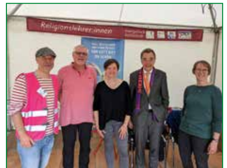
Thomas Söding, Vizepräsident des ZdK, im Zelt der Religionslehrer:innenverbände.