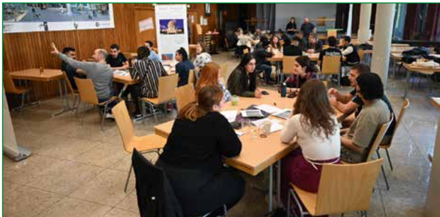
Die Living Library im Klaus-Steilmann-Berufskolleg.

Die methodische Einführung in die Living Library übernahm Sonja Lüddecke. Es wurden Fragen gesammelt, auf die man zurückgreifen konnte, wenn das Gespräch stockte. Doch diese wurden selten benötigt, da es