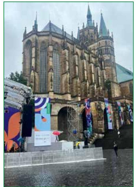
Der Erfurter Dom als malerische Kulisse zahlreicher Gottesdienste, Begegnungen und Diskussionen.