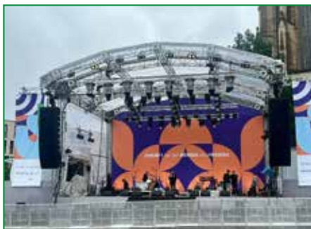
Zukunft hat der Mensch des Friedens: Das Motto des Katholikentages ist allgegenwärtig.