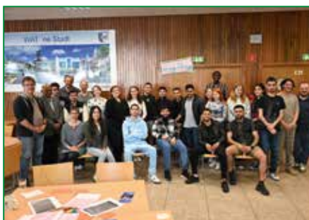
Living Books mit ihren Leser*innen.

zu einem anregenden Austausch zwischen den Schüler*innen und Vertreter*innen der Glaubensrichtungen kam.