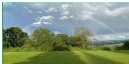
Was macht den VKR aus? Das Miteinander der Generationen!

Die Arbeitszeit von Lehrkräften soll zukünftig erfasst werden, nur wie? Kontrovers diskutiert wurden Jahresarbeitszeitmodelle. Problematisch ist, dass bei einer rein quantitativen Erfassung die Qualität der Arbeit nicht berücksichtigt wird. Ungeklärt ist, wer die Arbeitszeit erfassen und kontrollieren soll. Fragwürdig erscheint, dass eine minutengenaue Zeiterfassung zu mehr Motivation und Engagement beiträgt. Die bisherigen Arbeitszeituntersuchungen ha-