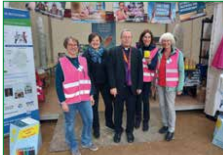
Bischof Bätzing, Vorsitzender der Deutschen Bischofskonferenz, bei den Standbetreuerinnen.